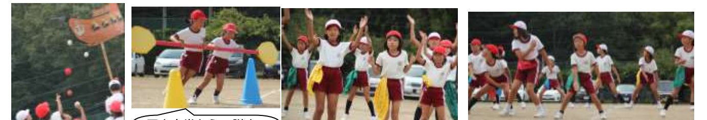
巨大竜巻からの脱出。必死でオールをこいでいます。