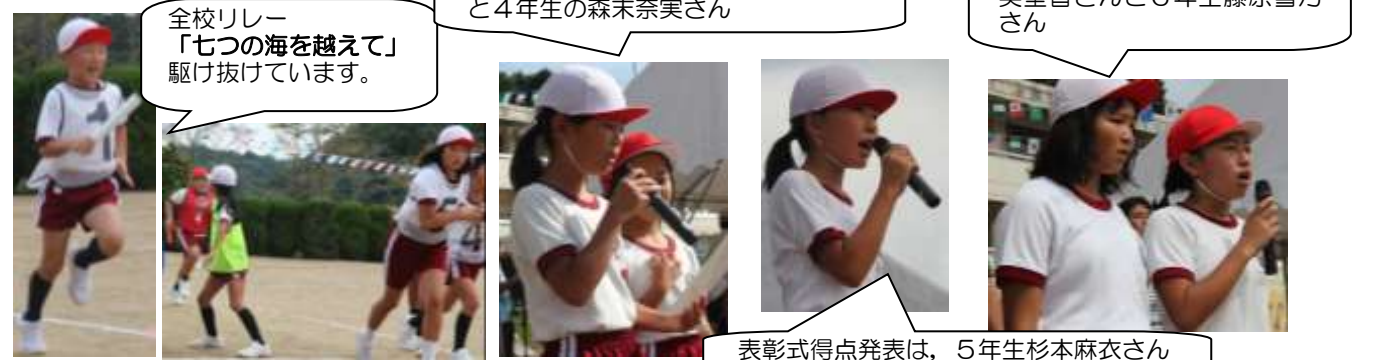
全校リレー「七つの海を越えて」駆け抜けています。