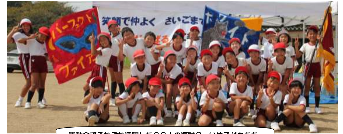
運動会でそれぞれ活躍した28人の海賊？ いや子どもたち