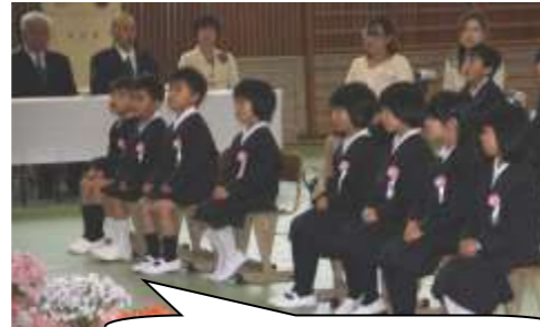
みんなお行儀よく座っています。