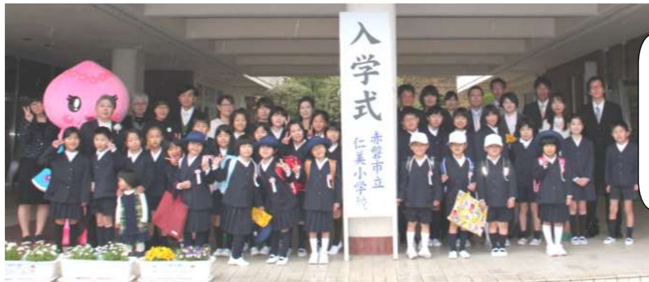
式後、ピロティで集合写真。天気は雨であたりは暗かったですが、みんなの顔は晴れやかでした。