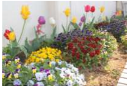
花壇のチューリップもきれいに咲き、祝福してくれているようです。