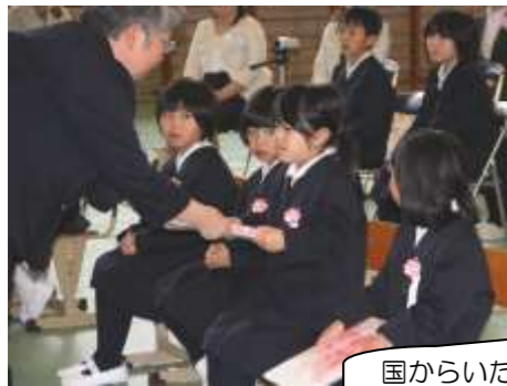
国からいただいた教科書です。大切にしておいて、しっかり勉強に役立ててください。