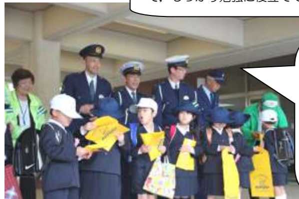
式終了後に、赤磐署、交通安全指導員の方より、新入生にランドセルカバーをいただきました。