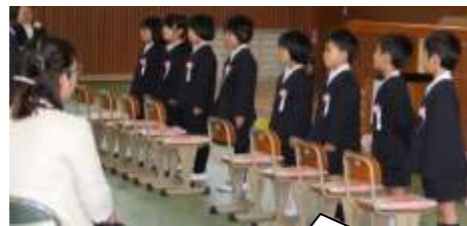
式の後半、上級生と向かい合い、お迎えの言葉や校歌を聞きました。