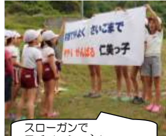
スローガンでモチベーション up