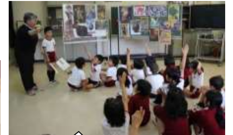
名画複製を使った〇×ゲーム 校長 (今回はおは読タイムで)