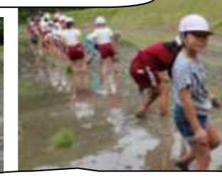
休憩なしで植えきりました。