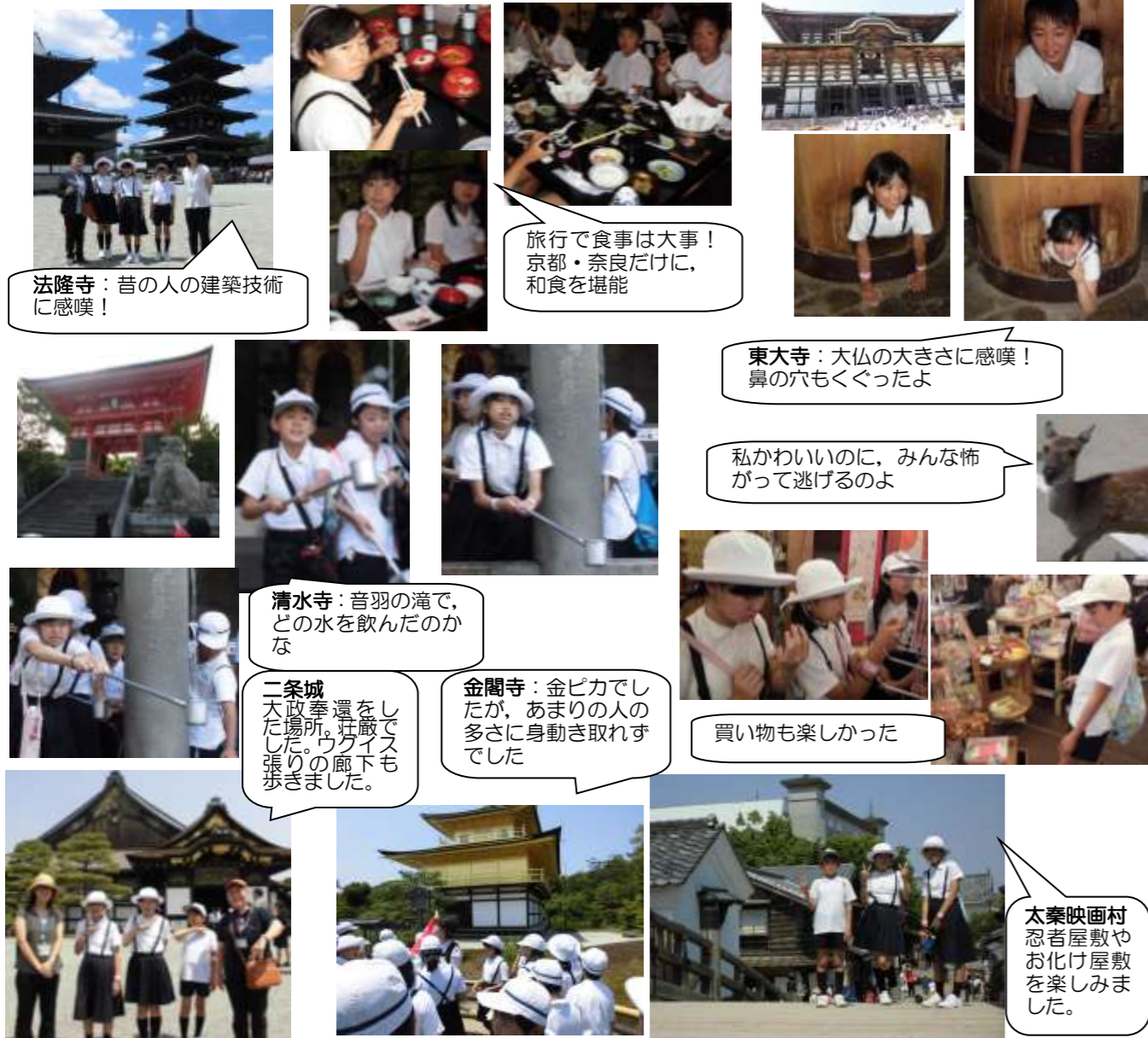
法隆寺：昔の人の建築技術に感嘆！

6年生は京都・奈良方面へ修学旅行に行ってきました。二日とも天候に恵まれ暑い中でしたが、みんな元気に予定通り回ることができ、教室で学習したことを実地に確かめることができました。城南小学校の友達とも交友を深めることができ、来年につながります。